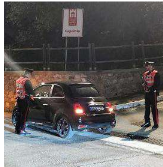
Carabinieri in azione nelle principali strade di collegamento tra Orbetello e Capalbio durante l'ultimo fine settimana

tracomunitari - presunti spacciatori - che in quest'ultima settimana avevano realizzato un centro di vendita di stupefacente. Il rastrellamento delle aree boscate ha infatti permesso di individuare, e successivamente smantellare, un accampamento di fortuna, seppur in quel momento non occupato da nessuno. Poi si è provveduto infatti a bonificare l'area con l'intervento di personale del servizio pubblico di raccolta dei rifiuti che ha rimosso, tra l'altro, un fornello