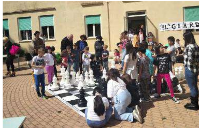
Alcuni dei ragazzi che hanno preso parte al progetto «lo imparo con gli scacchi»