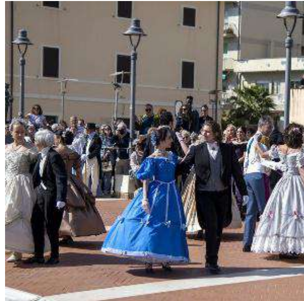
Nella città del Golfo due giorni di grandi eventi, con duecento figuranti, per la rievocazione storica «Follos»

gere piazza a Mare. Il corteo è passato tra gli applausi da via Bicocchi fino a Piazza a Mare dove si sono tenute le danze ottocentesche e i butteri maremmani. «Quest'anno, in occasione del centenario della città, abbiamo assistito a festeggiamenti speciali - ha detto l'assessora