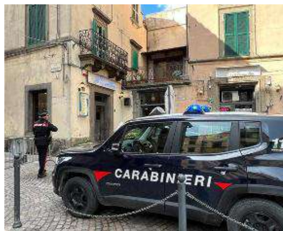
Un momento dei controlli compiuti dai carabinieri in paese nei giorni successivi alla rissa. Furono identificate oltre 100 persone

Ognuno, insomma, faccia la propria parte: «Le Amministrazioni comunali dovrebbero lavorare